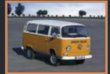
7 VW Combi 15 000 à 30 000€ +3