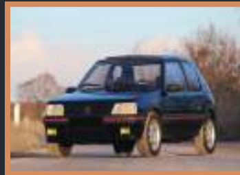
9 Peugeot 205 15 000 à 17 000€ -4