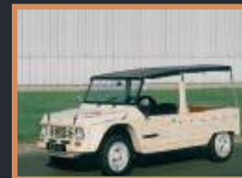
10 Citröen Méhari 15 000 à 20 000€ -1