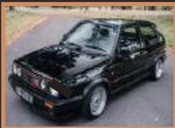
8 VW GOLF 10 000 à 15 000€ Entrée