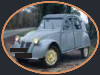
2 Citröen 2 CV 8500 à 11 000€ -1