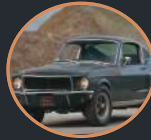
3 Ford Mustang 30 000 à 40 000€ -1