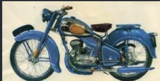
PEUGEOT 56 TL4