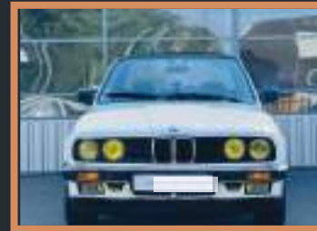
6 BMW série 3 5000 à 15 000€ -2