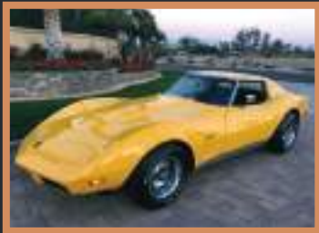
4 CHEVROLET Corvette 30 000 à 100 000€ Entrée