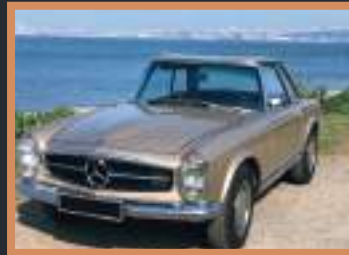
5 Mercedes SL 30 000 à 95 000€ +3